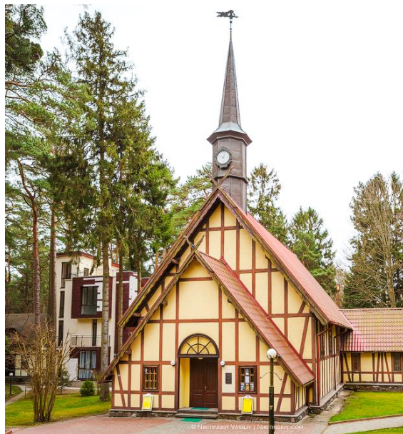
Частный органный зал